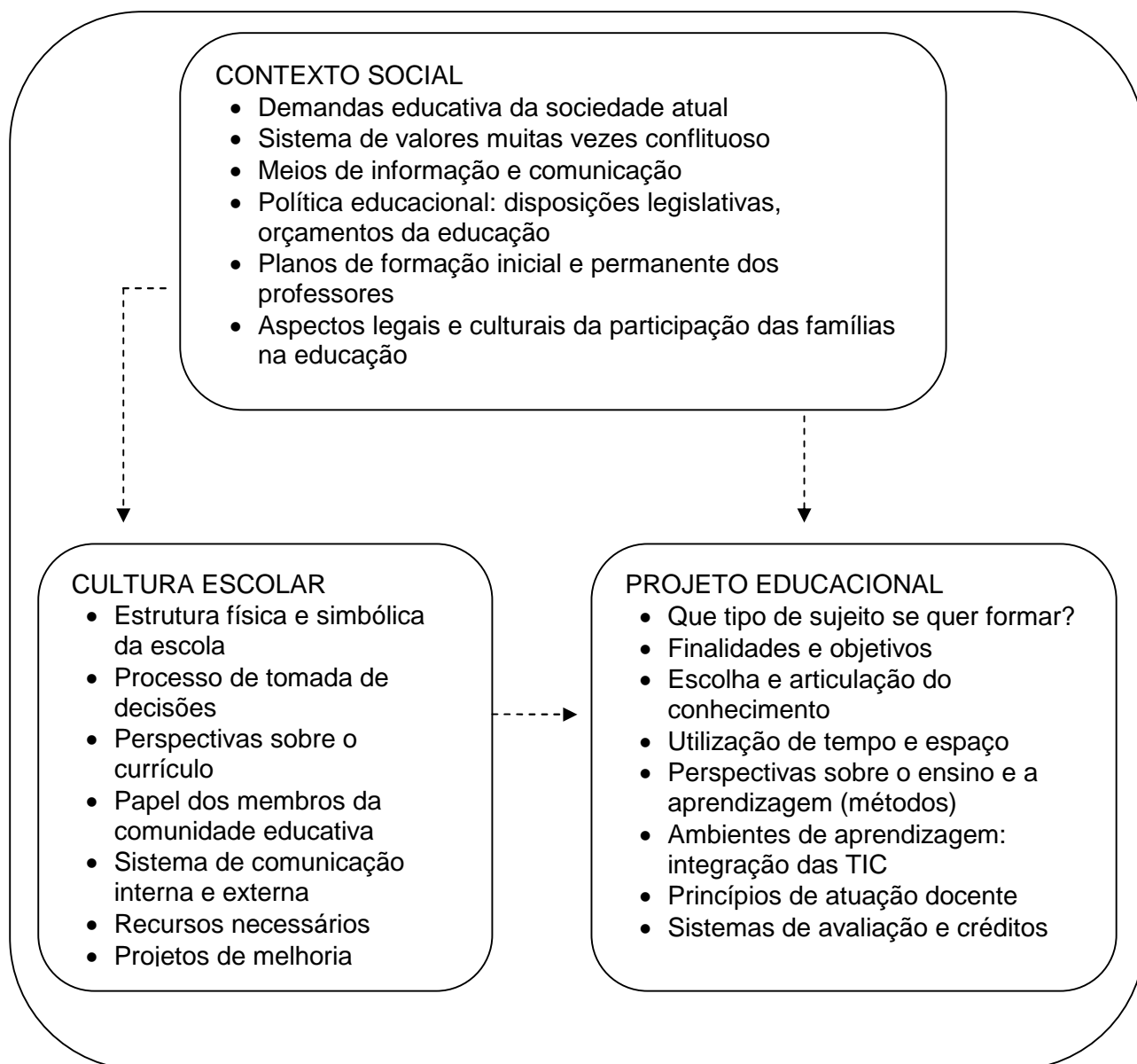
Figura 1. Planejamento integral da gestão da escola Fonte: SANCHO e HERNÁNDEZ, 2004, p. 30

Na Figura 1, Tedesco (2004, p.30) exemplifica pontos que, invariavelmente, devem ser observados para a compilação do Projeto.